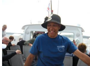
Le santon de service.